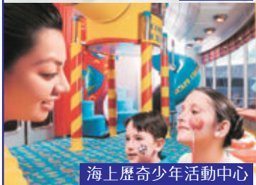
海上歷奇少年活動中心