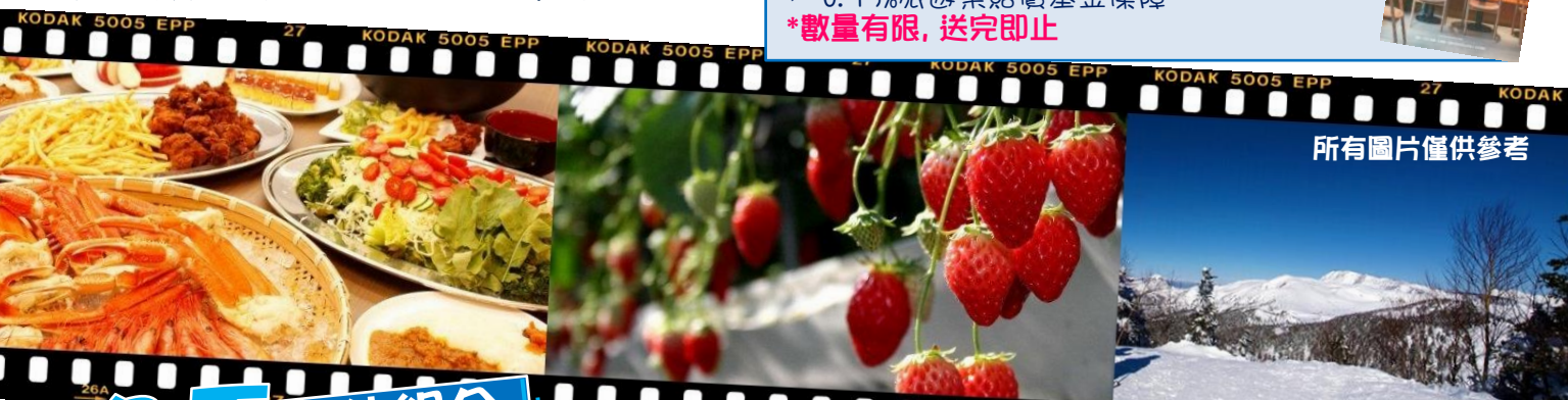
所有圖片僅供參考